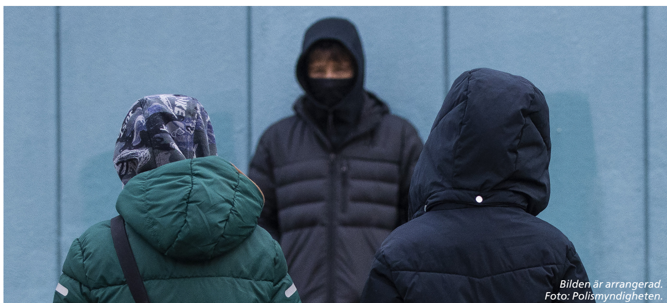
Bilden är arrangerad.