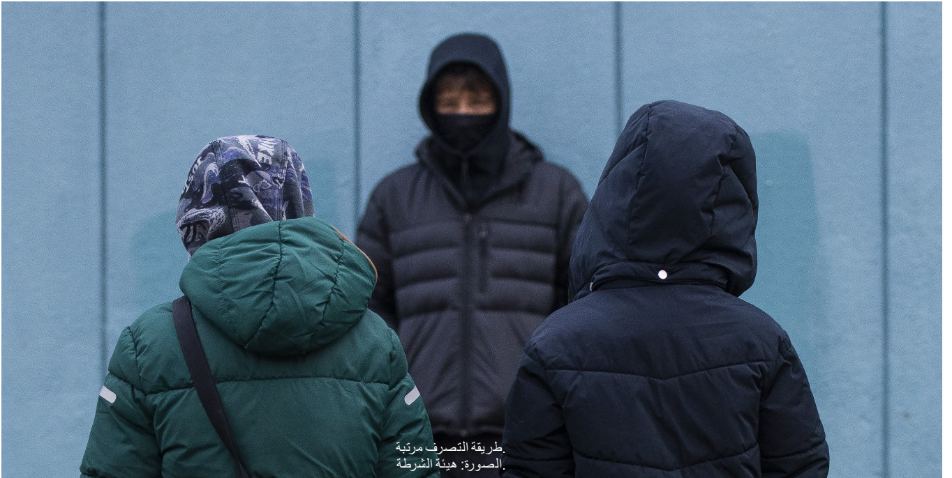
طريقة التصرف مرتبة